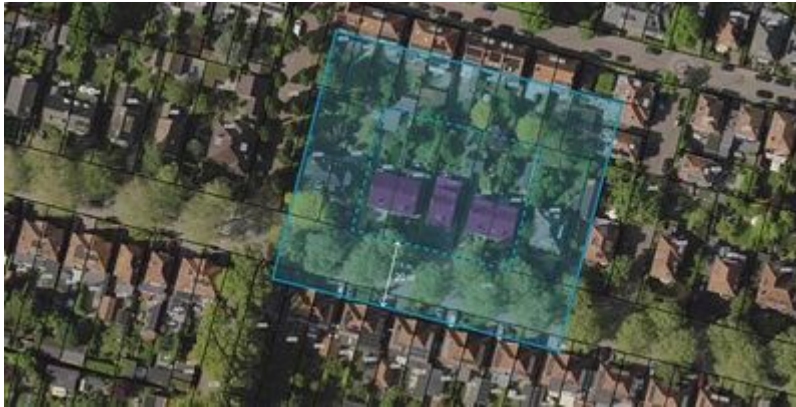
Figuur 2: Afb. 2. Voorbeeld generiek werkingsgebied M woonhuizen interbellumwijk

Leg de gekozen methoden kort en helder vast, zodat de contouren goed te begrijpen en te onderbouwen zijn. Dat kan in de toelichting bij het omgevingsplan, of in een aparte bijlage waarin per monument (of type monument) de gebruikte uitgangspunten en de gemaakte afwegingen worden beschreven.