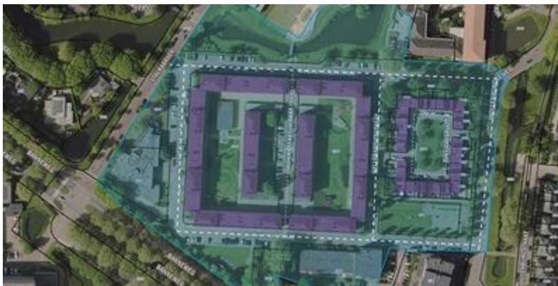
Figuur 3: Afb. 3. Voorbeeld maatwerk werkingsgebied voor een naoorlogs volkswoningbouwcomplex

Voorbeeld De gemeente Gorinchem heeft een getrapte aanpak gekozen waarbij meerdere methoden zijn toegepast, afhankelijk van het type en de ligging van het monument. Dit heeft geleid tot twee typen werkingsgebieden: